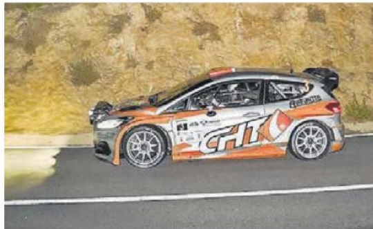
Espectacular fue la disputa del tramo del marchal de Enix, disputado el sábado ya de noche, que fue ganado por el triunfador del rallye, Pedro D.