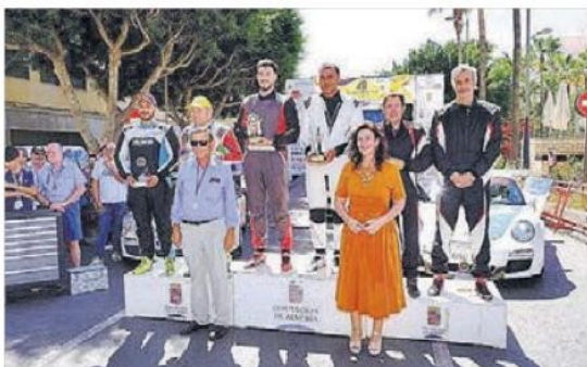
Imagen del podio en la Avda. Federico García Lorca de la capital.